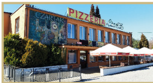
Fot. Restauracja „Czartak” – Gorzeń Górny, Archiwum Urzędu Miejskiego w Wadowicach

Budowę restauracji w Gorzeniu Górnym Gminna Spółdzielnia rozpoczęła w 1967 r. Jej otwarcie nastąpiło 1 lutego 1970 r. W piętrowym pawilonie gastronomicznym przewidziano restaurację, kawiarnię oraz bar z osobnym wejściem. Informacje o pracach budowlanych oraz początkach działania lokalu były na bieżąco zamieszczane w prasie. „Gazeta Krakowska” (1970 r./nr 50.) nadała jej miano: „najpiękniejszej restauracji w powiecie wadowickim”. Dekoracje ceramiczne autorstwa Bolesława Książka ozdobiły w 1969 r. elewację zewnętrzną i wnętrza gorzeńskiego pawilonu. Na całej ścianie restauracji na piętrze, naprzeciw wejścia była panorama doliny Skawy wykonana przez artystę malarza Andrzeja Dziegielewskiego z Krakowa. Natomiast płyty ceramiczne powstały w Spółdzielni „Kamionka” w Łysej Górze (ok. Tarnowa), w której aktywnie działał jeden z najwybitniejszych polskich ceramików – Bolesław Książek. Jego prace znajdują się w Muzeach Narodowych w Krakowie, Gdańsku, Wrocławiu i Warszawie oraz w wielu galeriach i zbiorach prywatnych na całym świecie. Wśród jego realizacji oprócz budynku Restauracji „Czartak” znajdziemy ceramikę architektoniczną m.in. w Teatrze Bagatela i Kinie Kijów w Krakowie oraz Dolnej stacji kolejki PKL Góra Parkowa w Krynicy-Zdroju.