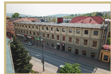
Fot. budynek, w którym w PRL mieściło się kino „Szarotka”, Archiwum Urzędu Miejskiego w Wadowicach

Kino cieszyło się dużą popularnością i często sala kinowa była pełna. Kino również było dostępne dla młodzieży z pobliskich szkół, ale wstęp do niego był tylko na dozwolone filmy. Zdarzało się, że podczas wieczornych seansów przeznaczonych dla dorosłych, uczniowie byli wypraszeni z kina.