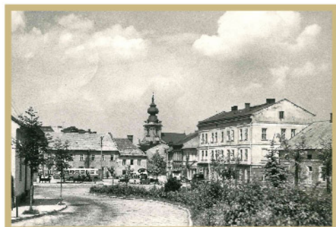
Fot. Dworzec PKS na pl. Kościuszki w Wadowicach w okresie PRL