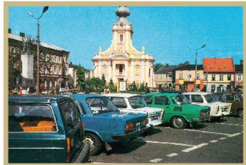
Fot. Rynek w Wadowicach w okresie PRL

Główny plac miasta w minionych stuleciach i dziesięcioleciach ulegał znacznym zmianom. Do 1974 r. w rogu placu przy ul. Sobieskiego funkcjonowała stacja benzynowa, której początki sięgały czasów okupacji hitlerowskiej. Wówczas wybetonowano przestrzeń wokół kościoła oraz wykonano mury oporowe i schody po południowej stronie placu. Do 1960 r. przy kamienicy nr 16 istniała fontanna. Na lata 60-te ubiegłego wieku przypadł okres, w którym zadrzewiono i zazieleniono wadowicki rynek. Pojawiły się klomby, alejki i nowoczesna fontanna przy ul. Krakowskiej, które stanowiły oazę zieleni. Po 1975 r. rozpoczął się okres ograniczania zieleni w centrum miasta. Ówczesną ozdobę rynku stanowił pomnik poświęcony żołnierzom Armii Czerwonej, w kształcie ostrosłupa. Pod koniec lat 70-tych zastąpiono go pomnikiem wykonanym przez miejscowego rzeźbiarza – Franciszka Suknarowskiego. Ciekawą, a dziś zapomnianą, egzotyczną ozdobą przestrzeni rynku w okresie letnim były wielkie donice z agawami.