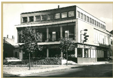
Fot. siedziba MDH – Miejskiego Handlu Detalicznego, Plac Obrońców Westerplatte 18

Dwukondygnacyjny gmach przy Pl. Obrońców Westerplatte 18 powstał ok. 1965 r. i był własnością Wojewódzkiego Przedsiębiorstwa Handlu Wewnętrznego. To w nim, na parterze, umieszczono „Pewex” czyli Przedsiębiorstwo Eksportu Wewnętrznego. Pierwotnie zajmował on lokal przy wadowickim rynku pod nr 13. Pewex w okresie PRL-u był przedsiębiorstwem państwowym, prowadzącym sieć sklepów i kiosków walutowych. Powstało ono w 1972 r. z przekształcenia sklepów dewizowych banku PeKaO. Jako jeden z nielicznych punktów sprzedaży w swojej ofercie posiadał towary luksusowe dystrybuowane na Zachodzie. W całej Polsce było ich ponad 800 punktów! Aby móc kupować w Pewexie trzeba było posiadać dolary. Jeżeli ktoś ich nie miał, mógł je nabyć w przysklepowym kiosku. Sklep oferował produkty i dobra, których nigdzie indziej w kraju nie można było dostać. To powodowało, że zakupy w tym przedsiębiorstwie były „luksusowe”. Można tam było nabyć m.in.: odzież (w tym oryginalne dzinsy), zegarki, urządzenia AGD i RTV (jak walkmany, wieże stereo), zabawki (klocki LEGO, samochodziki Matchbox), perfumy czy kosmetyki.